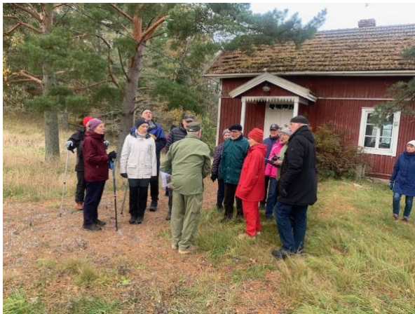
Här har kanske Per Brahes skeppsbyggare bott