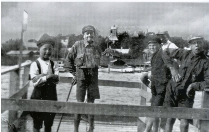
Personfärjan över till Munkvik Haga