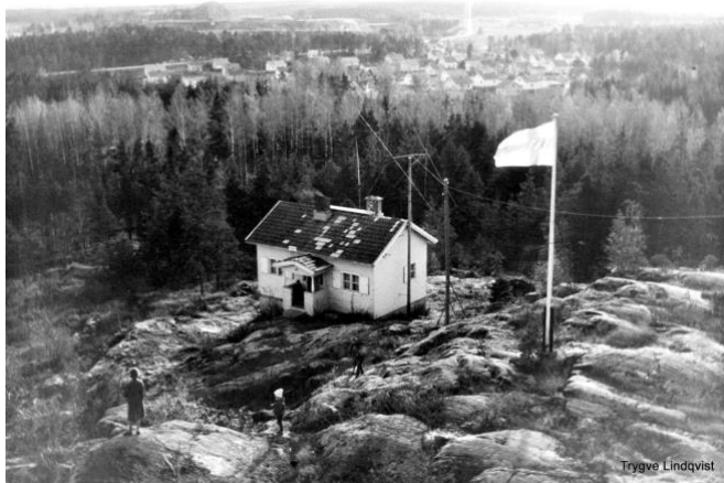
Vaktstugan vid Finby klint