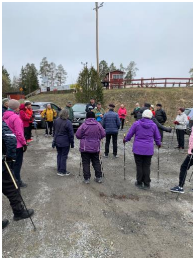
Vandringen startade vid skidstadion

Rauhala kallas av lokalbefolkningen för Sprättas, som måste rivas och ge plats för avfallsdepån och för rekreationen.