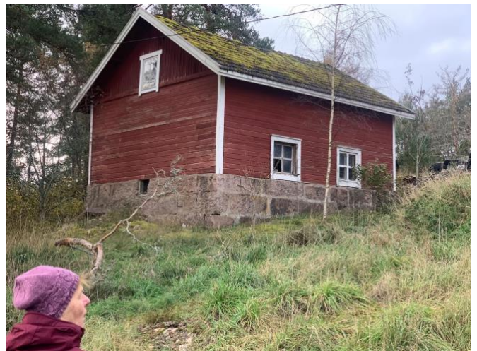
Här tvättades skeppsbyggarnas kläder?