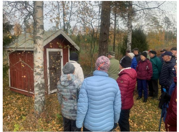
Gaslager för en fyr transporterat från holmarna