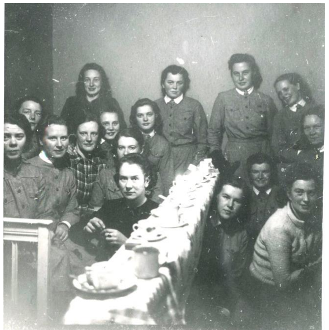
Lottor som deltog i bevakningen