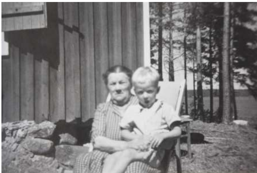
Text och foto: Ulla-Maj Lübchow

PS. Området där vi hyrde scoutstugan heter Kopparö och holmen vi besökte heter Kalvholmen.