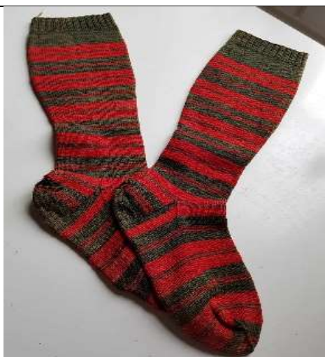
Pargassocken. Den ursprungliga sockan är troligen från slutet av 1800-talet.