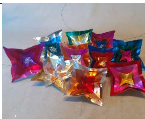
Segerströmska stjärnor. Traditionell julpyrning från Pargas.