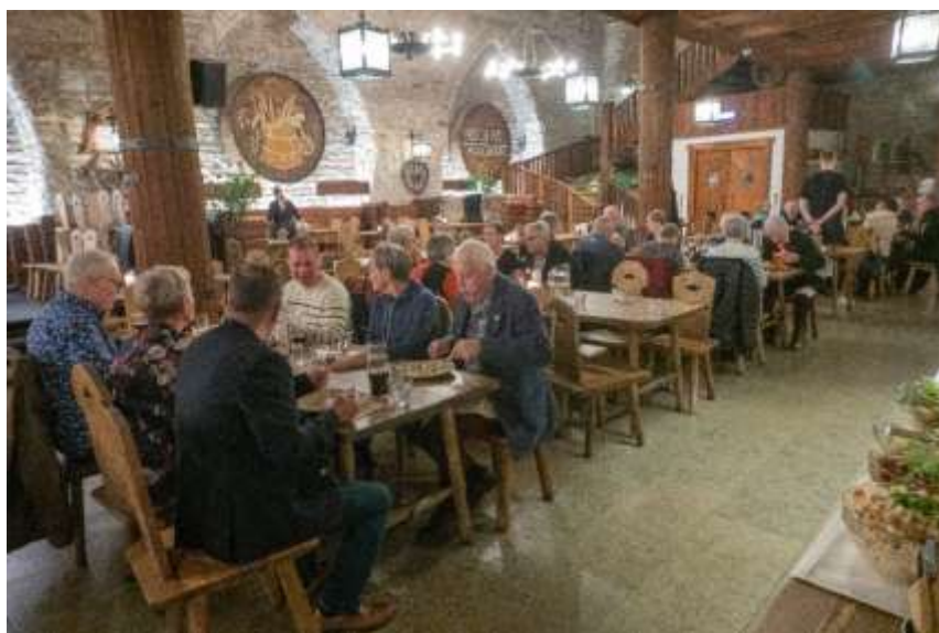
Efter tävlingarna smakade det med en god middag