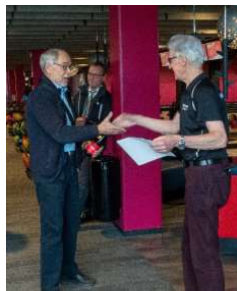
Arvo vann herrarnas B-final