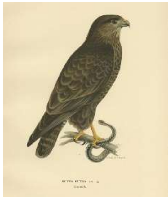
Bild 3. Ormvråk med huggorm i klorna. Målning av Magnus von Wright

Vår hiirihaukka heter på svenska ormvråk. Enligt moderna fågelböcker utgörs ormvråkens föda främst av smågnagare och fåglar, men den kan ibland också fånga ormar. År 1828 utkom boken Svenska Foglar i Sverige med litografier av Magnus von Wright från Finland. I den boken avbildas ormvråken med en orm i klorna! Kan bilden ha inverkat på namngivningen eller avspeglar den uppfattningen i Sverige?