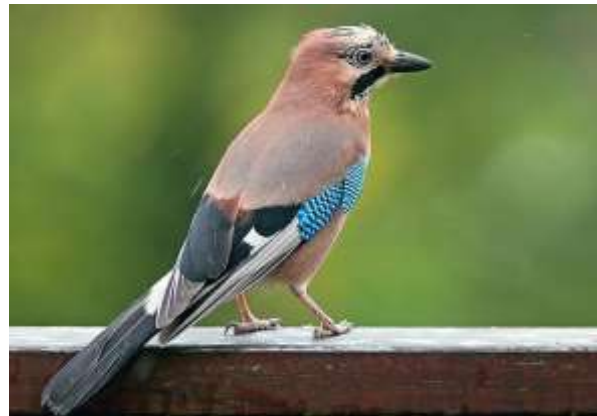
Bild 1. Päärosjooro är en vacker fågel som finns i hela landet. Lätet är förfärligt

ned fågeln i snön. Efter det sköt jag aldrig mera på fåglar.