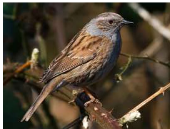
Bild 7. Järnsparv Prunella modularis . Brunört Prunella vulgaris

En felstavning är troligen orsak till det lilla felet i Linnés fantastiska namngivningssystem!