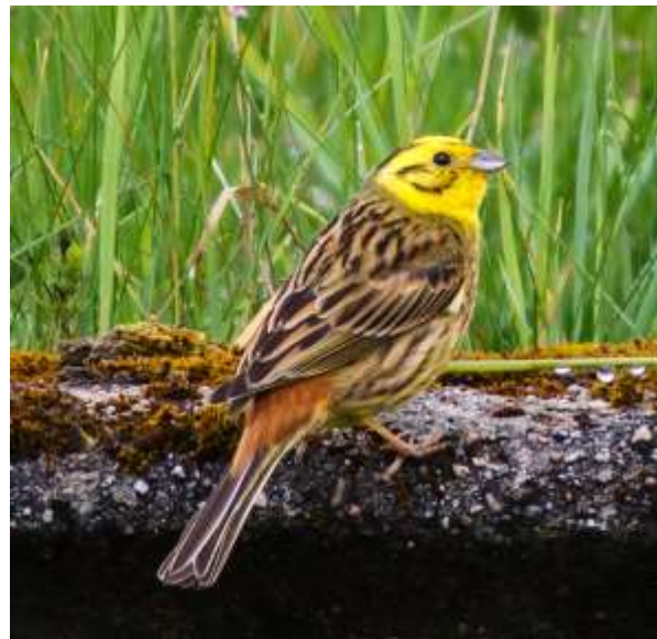
Bild 2. Gålatisttons hane har en vackert gul hjässa. Den kommer gärna till vintermatningen, men vill ha havre direkt