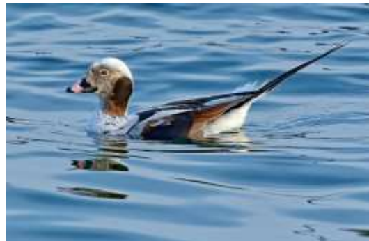
Bild 4. Alfågel

Ett namnpar som man kunde tro är en direkt översättning från svenska till finska är alfågel – leppälintu . Det är ändå fråga om två helt olika fåglar, en andfågel och en tätting. Alfågeln heter alli på finska och båda namnen är onomatopoetiska och kommer från fågelns läte a-állli a-állli . I namnet leppälintu har förstaveln leppä inget att göra med trädet al utan det är fråga om ett gammalt finskt ord för blod som återfinns i det finska namnet på blodrisk, leppärousku . Fågeln svenska namn är rödstjärt.