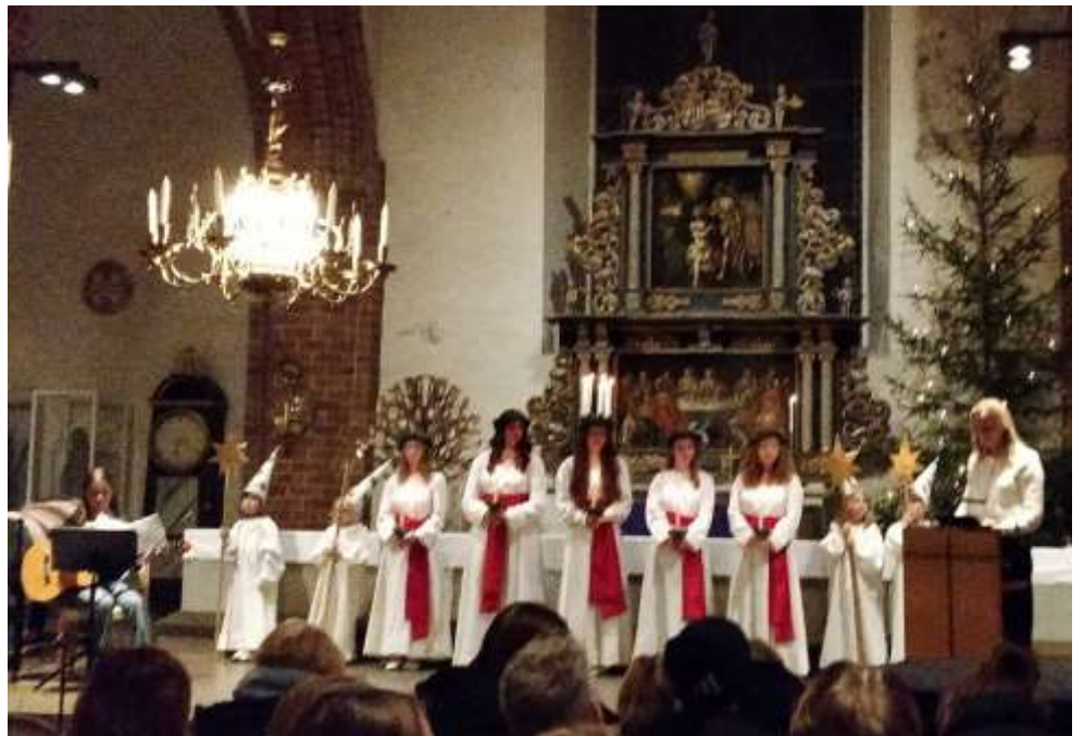
Luciakröningen i Pargas kyrka.