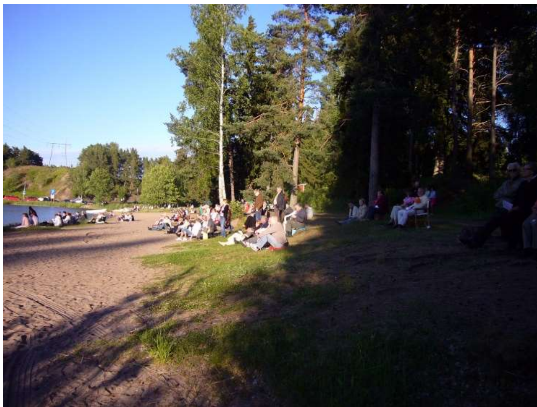
Talrik publik på "Natt vid havet"

OBS! Aktuellt material till Parentesen, t.ex. ändringar i gruppsammansättning eller kontaktpersoner, måste vara redaktionen tillhanda senast en vecka före månadsträffen för att hinna med. Även annat material i form av hågkomster, bilder eller teckningar tas gärna emot av redaktionen med samma förbehåll.