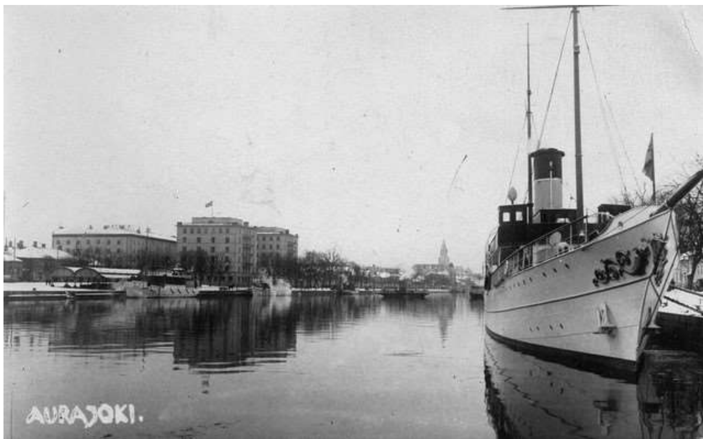
Seagull i Aura å på 1930-talet

(Texten är ett utdrag ur ett kapitel med vilken författaren bidragit till antologin "Från varven ut på världshaven – skeppsbyggeriets historia i Finland. Utg. Forum Marinum, 2017.)