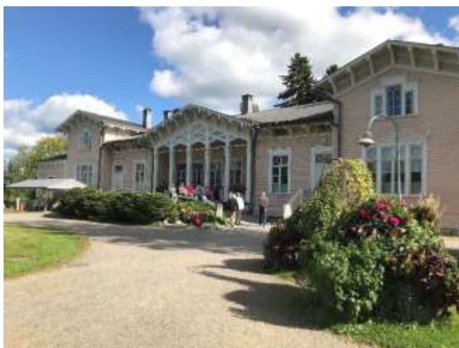
Fd prästgård och nu restaurang Kenkävero