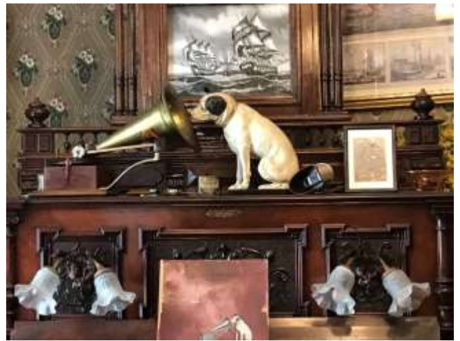
His Masters Voice.