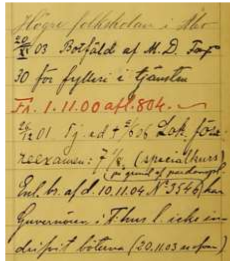
”Anmärkningar” i en Järnvägsatrikel

I gruppen finns sådana som släktforskat tidigare såväl som sådana som just har börjat. Ibland har någon av deltagarna presenterat delar av sin forskning, eller en hel forskning och emellanåt bidrar någon med ett knepigt problem eller en otrolig lösning på ett svårt och segt problem. Många spännande och varierande livsöden har berörts under åren.